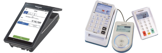
※stera terminal

(※端末によりご利用できる決済・機能が異なります。詳しくは事務局へお問い合わせください。)